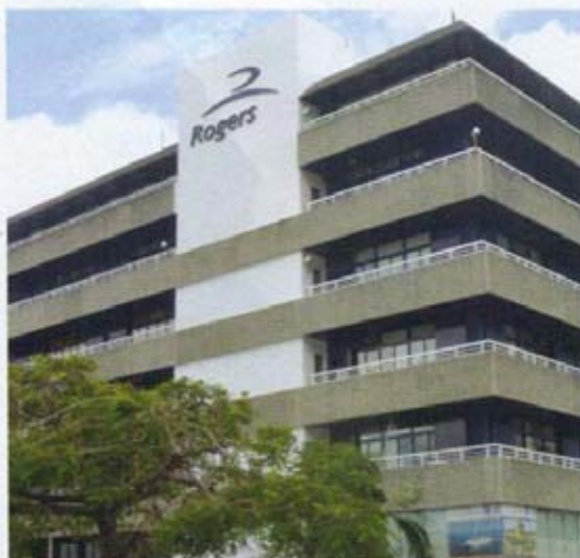
Rogers entend créer une plate-forme pour ses investissements.