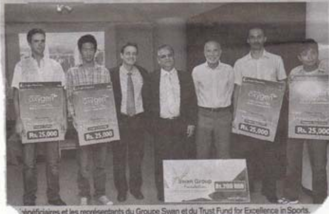
beneficiaires et les représentants du Groupe Swan et du Trust Fund for Excellence in Sports.