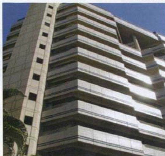
La Swan se positionne comme le pôle financier de Rogers.

L es acquisitions, fusions et restructurations de capitaux pourraient changer la configuration du paysage commercial. Ainsi, Rogers s'apprête à fusionner avec Swan dans le but de créer une nouvelle plate-forme stratégique au niveau de ses investissements. Un nouveau pôle Assurance et Investissement verra le jour l'année prochaine à la suite de ce partenariat.