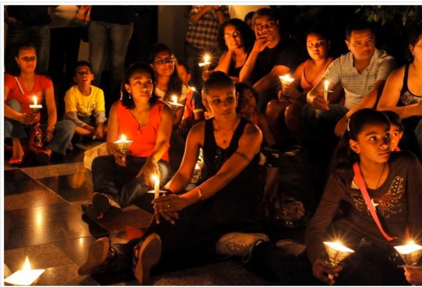
Earth Hour 2012 à la Swan Group.

L'événement mondial lancé par la WWF depuis 2007 a pour but de conscientiser les citoyens chaque année, en les appelant à lutter contre le changement climatique, le temps d'une heure ( http://www.earthhour.org ).